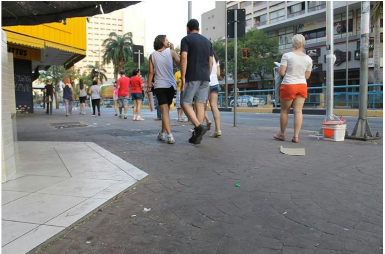
(Passeio guiado - Centro de Goiânia)