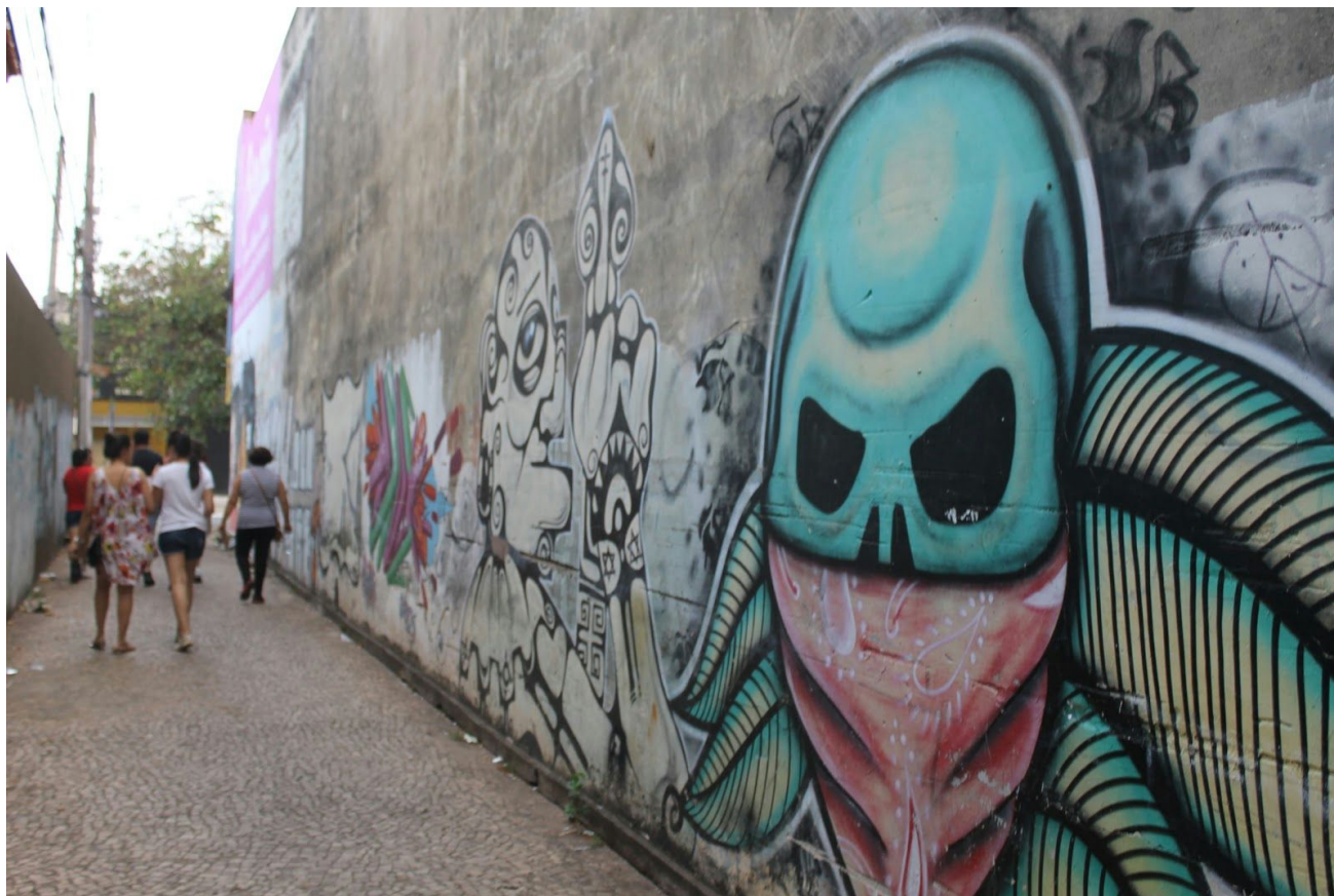
(Passeio guiado - Centro de Goiânia)

Os passeios serão conduzidos pela Sobreurbana e produzidos pela Hábil Produção . A Sobreurbana é um estúdio de intervenções urbanas que trabalha pela qualificação de espaços públicos e promoção da cultura urbana e desde 2013 realiza passeios guiados a pé em Goiânia, com o objetivo de levar as pessoas para as ruas para conhecerem melhor a cidade onde vivem.